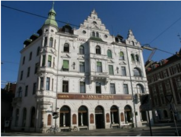
Wohn- und Geschäftshaus A. Zankl & Söhne („Zanklhof“), (c) Kulturserver Graz

Bei den Auswanderungsunterlagen (Auswanderungsfragebogen) im Archiv der Israelitischen Kultusgemeinde wurde zuletzt die Adresse Sackstr. 21 angegeben (ohne entsprechende Änderung im Melderegister; ev. handelte es sich bereits eine nicht mehr wirklich freiwillige Wohnstätte, sondern Übergangswohnung nach Auflösung der eigenen Wohnung).