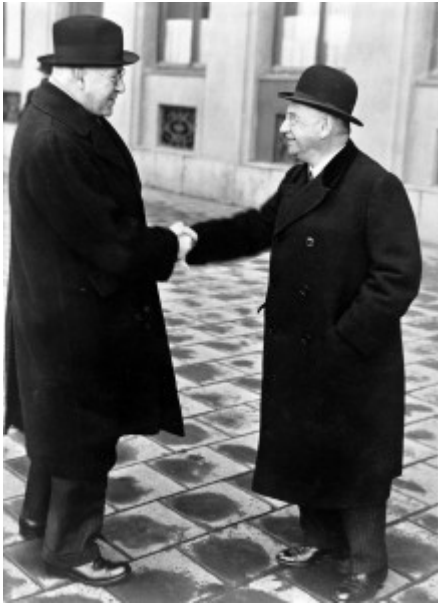
Foto 2: Otto Loewi und Henry Dale 1936 in Stockholm, anlässlich der Verleihung des Nobelpreises

Nach dem „Anschluss“ Österreichs an Deutschland wurde der mittlerweile 65-jährige Loewi für zwei Monate in „Schutzhaft“ genommen und danach bedrängt, das Land zu verlassen: Schon in der Nacht vom 11. auf den 12. März 1938 wurde er im Zuge einer nationalsozialistischen Verhaftungswelle prominenter Repräsentanten des austrofaschistischen Ständestaates und prominenter Juden inhaftiert. Loewi schrieb in seinen Erinnerungen, dass er sich dem Ausmaß der politischen Entwicklungen bis zu diesem Zeitpunkt nicht vollständig bewusst gewesen wäre. Besonders schockiert war er in jener Nacht darüber, dass unter den Gestapo-Leuten auch ein Sohn eines Kollegen von der Universität dabei war. Loewi wurde noch während seiner „Schutzhaft“ im Zuge der Gleichschaltung der Universitäten beurlaubt und in den vorzeitigen Ruhestand versetzt.