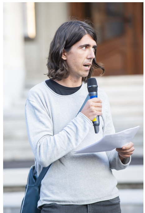
Verlegung von Stolpersteinen vor der Oper Graz am 18.09.2020