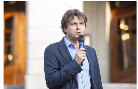
Verlegung von Stolpersteinen vor der Oper Graz am 18.09.2020